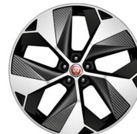
22" KOLA S 5 PAPRSKY GLOSS BLACK, DIAMOND TURNED, S PRVKY Z UHLÍKOVÉHO KOMOZITU (STYLE 5069)