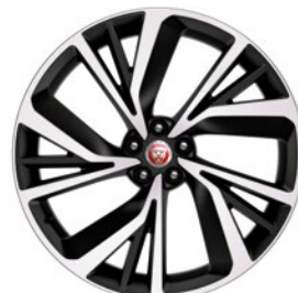
22" KOLA S 5 DVOJ. PAPRSKY DIAMOND TURNED (STYLE 5056)