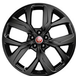
20" KOLA S 5 PAPRSKY GLOSS BLACK (STYLE 5068)