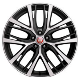
20" KOLA S 5 DVOJ. PAPRSKY TECHNICAL GREY, DIAMOND TURNED (STYLE 5070)