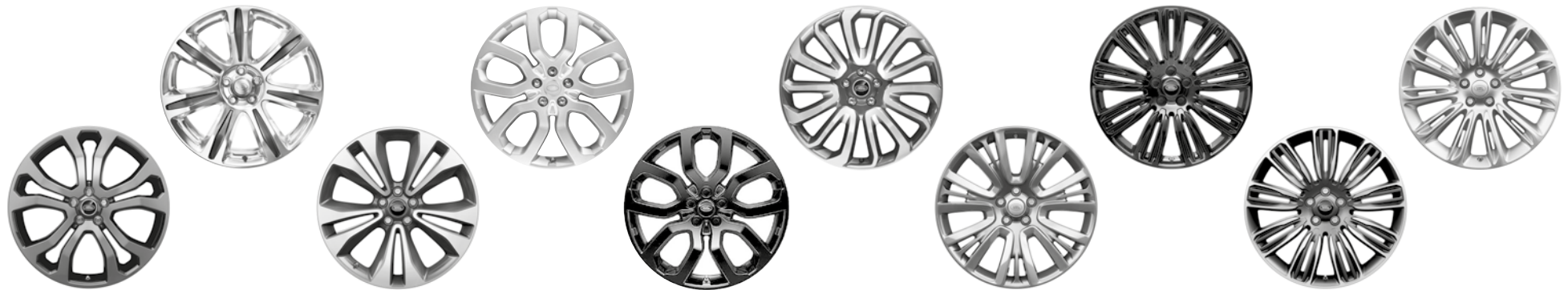
21" KOLA S 5 DVOJITÝMI PAPRSKY DARK GREY (STYLE 5005)