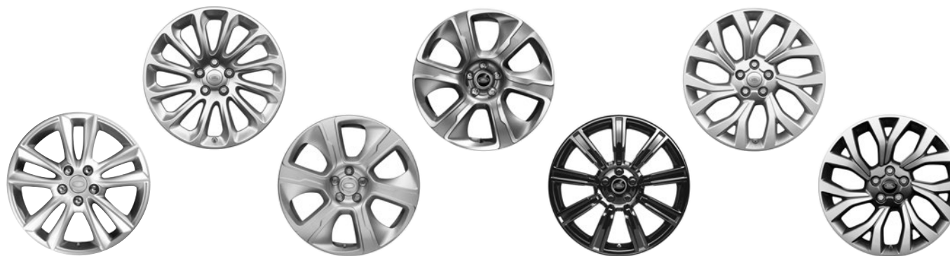
19" KOLA S 5 DVOJITÝMI PAPRSKY (STYLE 5001) 1