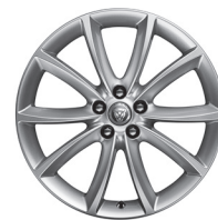
19" s 10 paprsky Styl 1023 Silver [029ZF]