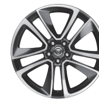
19" s 5 dvojitými paprsky Styl 5058 Technical Grey, Diamond Turned [029ZA]