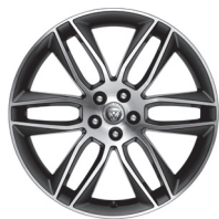
20" se 6 dvojitými paprsky Styl 6003 Dark Grey, Diamond Turned [029Z1]