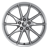
18" s 10 paprsky Styl 1036 Silver [031FK]