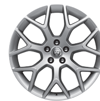
19" se 7 dvojitými paprsky Styl 7013 Silver [029ZK]