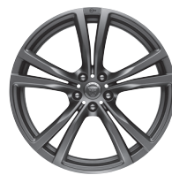
20" s 5 dvojitými paprsky Styl 5061 Satin Grey [031JT]