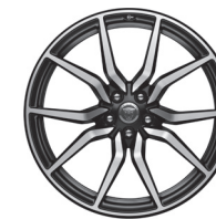
20" s 10 paprsky Styl 1041 Satin Black, Diamond Turned [031JR]

87 604 87 604 87 604 65 692 65 692 65 692