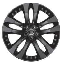
20" s 5 dvojitými paprsky Styl 5039 Gloss Black [029ZL]