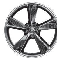
20" s 5 paprsky Styl 5042 Carbon Fibre, Satin Grey, Diamond Turned [029ZS]