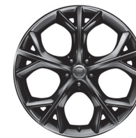
20" s 5 dvojitými paprsky Styl 5040 Metallic Black [031FN]