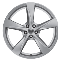
20" s 5 paprsky Styl 5060 Silver [031FL]