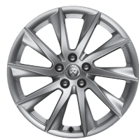
18" s 10 paprsky Styl 1024 Silver [029ZG]