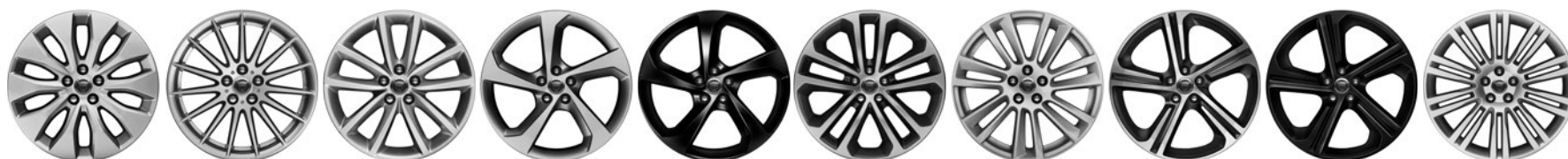
18" 10 paprsků Style 1021 Silver O29YF