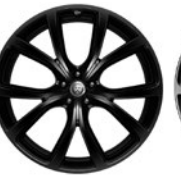
22" 5 dvojj. paprsků Style 5081 Gloss Black 031QX