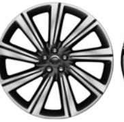
22" 9 paprsků Style 9006 Grey, Diamond Turned 029YC