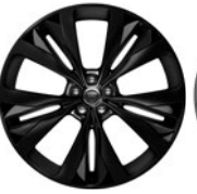
22" 15 paprsků Style 1020 Gloss Black, Satin Black inserts 029YB