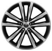
20" 5 dvojj. paprsků Style 5031 Grey, Diamond Turned 029XY