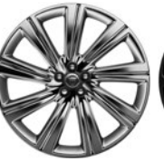
22" 9 paprsků Style 9006 Chrome 029YD