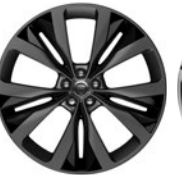
22" 15 paprsků Style 1020 Grey, contrast inserts 029YE