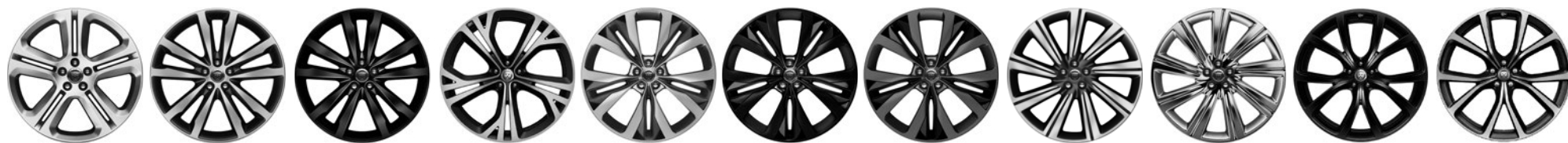
20" 5 dvojj. paprsků Style 5036 Silver 029XW 20" 5 dvojj. paprsků Style 5031 Grey, Diamond Turned 029XY 20" 5 dvojj. paprsků Style 5031 Gloss Black 029XZ 21" 5 dvojj. paprsků Style 5080 Grey, Diamond Turned 031QW 22" 15 paprsků Style 1020 Silver, contrast inserts 029YA 22" 15 paprsků Style 1020 Gloss Black, Satin Black inserts 029YB 22" 15 paprsků Style 1020 Grey, contrast inserts 029YE 22" 9 paprsků Style 9006 Grey, Diamond Turned 029YC 22" 9 paprsků Style 9006 Chrome 029YD 22" 5 dvojj. paprsků Style 5081 Gloss Black 031QX 22" 5 dvojj. paprsků Style 5081 Grey, Diamond Turned 031QY