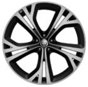
21" 5 dvojj. paprsků Style 5080 Grey, Diamond Turned 031QW