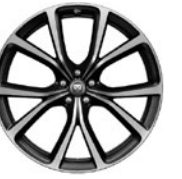
22" 5 dvojj. paprsků Style 5081 Grey, Diamond Turned 031QY