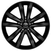
20" 5 dvojj. paprsků Style 5031 Gloss Black 029XZ