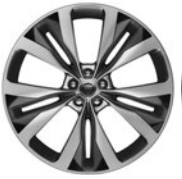
22" 15 paprsků Style 1020 Silver, contrast inserts 029YA