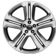
20" 5 dvojj. paprsků Style 5036 Silver 029XW