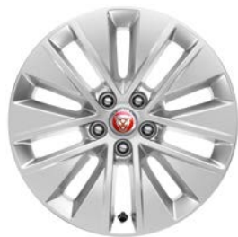
17" KOLA S 10 PAPRSKY STYL 1037