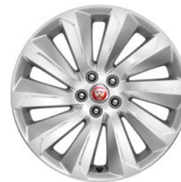
19" KOLA S 10 PAPRSKY STYL 1039 Standardně pro E-PACE SE