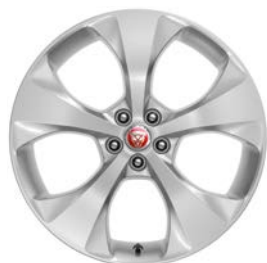
20" KOLA S 5 PAPRSKY STYL 5054 Standardně pro E-PACE HSE