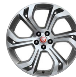
20" KOLA Z LEHKÉ SLITINY SE 6 DVOJITÝMI PAPRSKY, SATIN GREY, DIAMOND TURNED (STYL 6014)*

V interiéru této speciální verze dominuje exkluzivní kůže Windsor v odstínu Ebony s kontrastním prošíváním v ohnivém odstínu Flame Red. Tečku za exkluzivním vzhledem First Edition tvoří speciální koberečové rohože a prahové lišty z ušlechtilé oceli s emblémem First Edition. Elegantní atmosféru dotváří vysoce kvalitní čalounění stropu velurem Premium. Součástí standardní výbavy je rovněž průhledový displej.