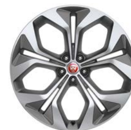
21" KOLA S 5 DVOJITÝMI PAPRSKY, SATIN GREY, DIAMOND TURNED STYL 5053