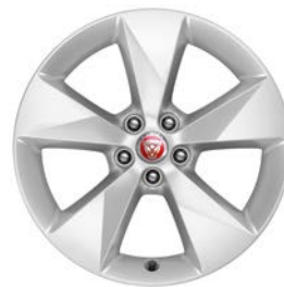
18" KOLA S 5 PAPRSKY STYL 5048 Standardně pro E-PACE R-Dynamic S