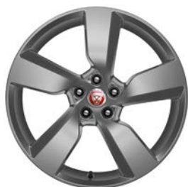
19" KOLA S 5 PAPRSKY, SATIN DARK GREY STYL 5049