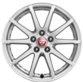
17" KOLA S 10 PAPRSKY STYL 1005 Standardně pro E-PACE a E-PACE R-Dynamic