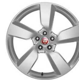
19" KOLA S 5 PAPRSKY STYL 5049 Standardně pro E-PACE R-Dynamic SE