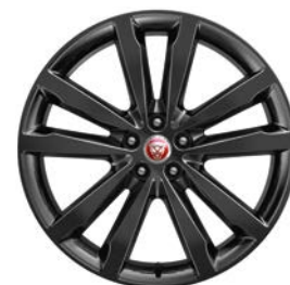
20" KOLA S 5 DVOJITÝMI PAPRSKY, GLOSS BLACK STYL 5051