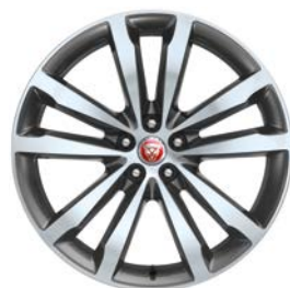
20" KOLA S 5 DVOJITÝMI PAPRSKY, SATIN GREY, DIAMOND TURNED STYL 5051 Standardně pro E-PACE R-Dynamic HSE