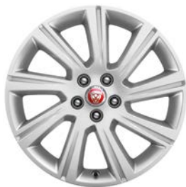
18" KOLA S 9 PAPRSKY STYL 9008 Standardně pro E-PACE S